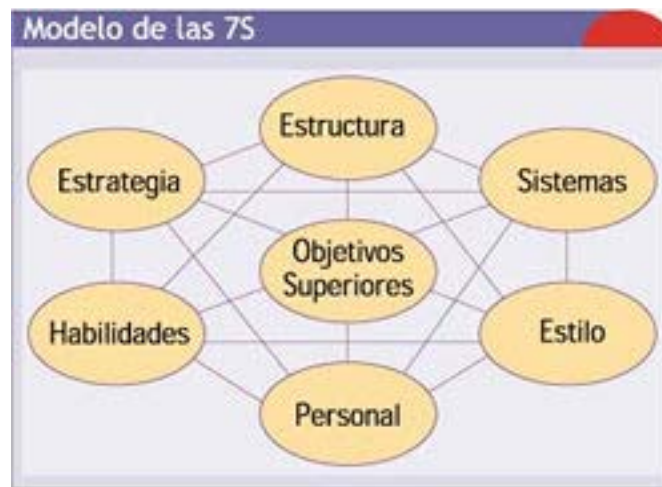
Figura N° 2