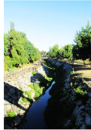
Estero Las Toscas