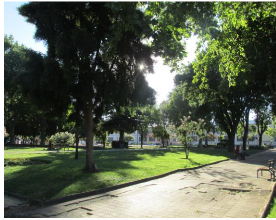
Plaza La Victoria y Plaza Santo Domingo (Ambas colindantes a la Avenida O'Higgins)