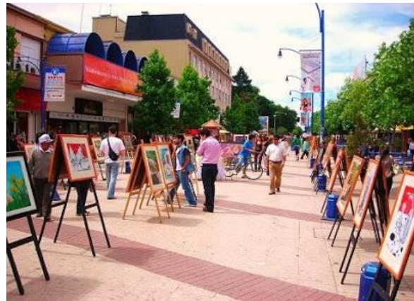
Paseo Arauco, Paseo Peatonal de Chillán