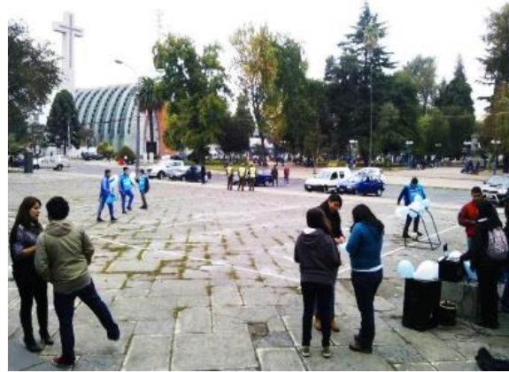
Dos ángulos diferentes del frontis de la Gobernación Provincial de Ñuble