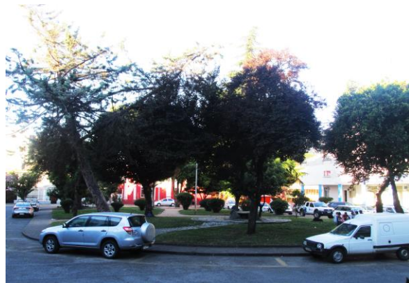
Interior de la Gobernación Provincial de Ñuble: Pasillos techados y Plaza Los Naranjos