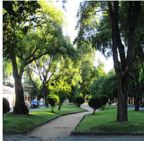
Áreas verdes en los bandejones de las principales avenidas de Chillán (Avda. Argentina, Collín y Brasil)