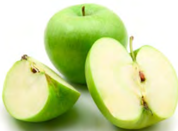
Ensalada California con suprema de pollo

Información nutricional por porción: Energía 78 kcal; proteínas 0 g; grasa total 0 g; colesterol 0 mg; carbohidratos 20 g; fibra 2,6 g; sodio 0 mg.