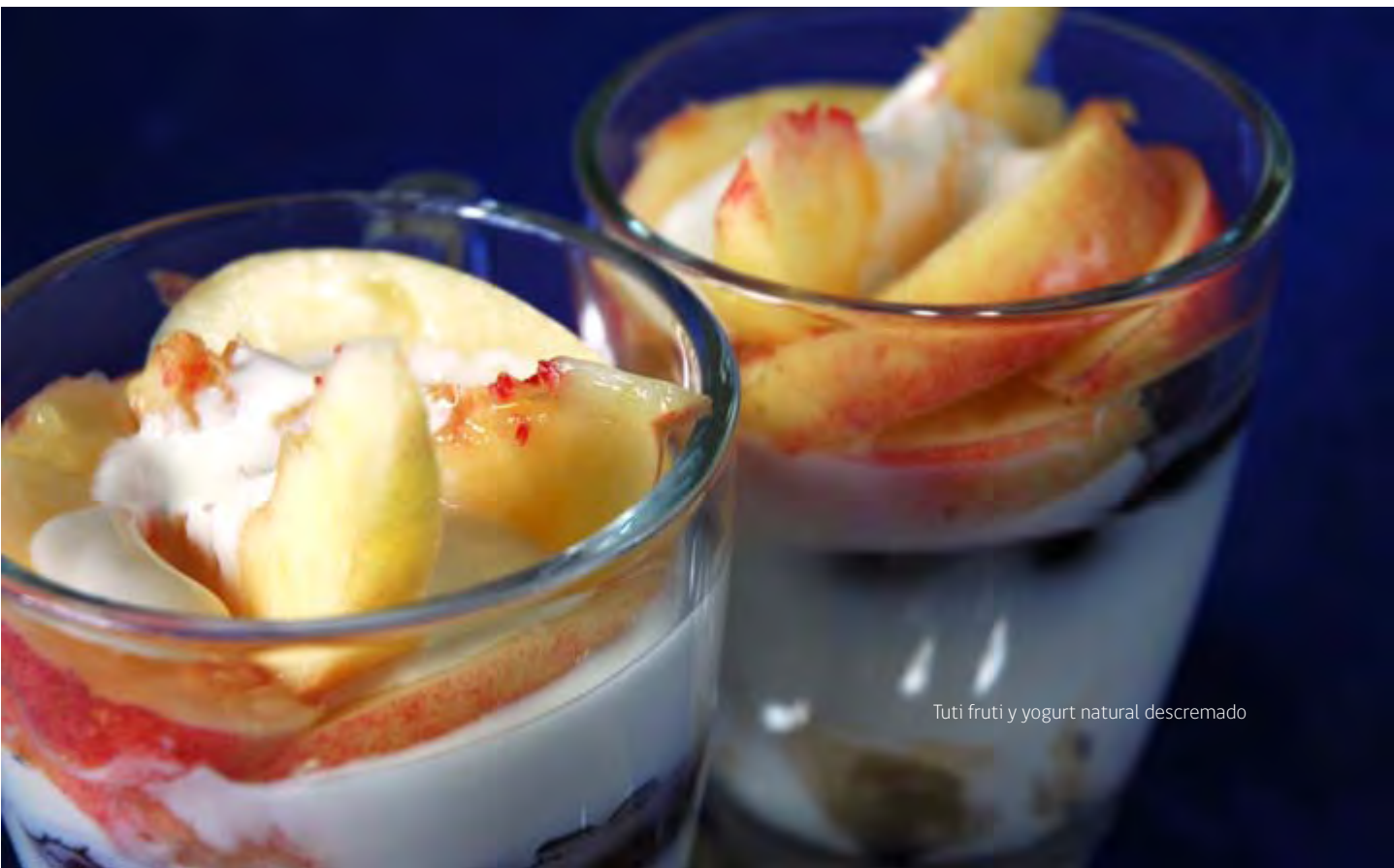
Tuti fruti y yogurt natural descremado

“Aumentar al doble el tamaño de la porción de verduras que come habitualmente”