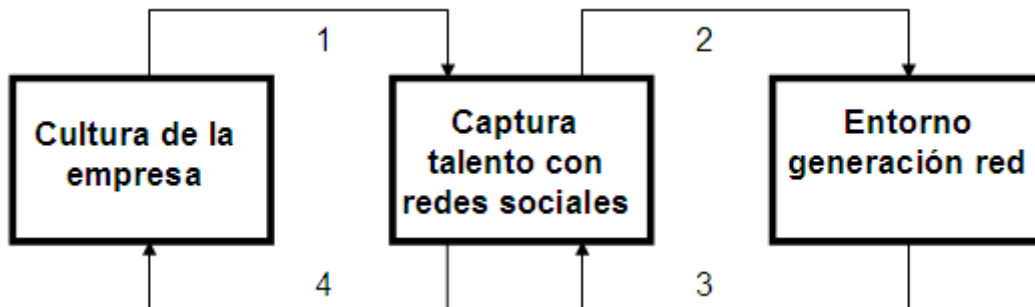
Influencia de la cultura empresarial

Este diagrama representa diferentes tipos de influencias causa efecto. Por un lado, la cultura empresarial tiene un efecto de ayuda o de freno sobre el proceso innovador de la captura de talento a través de las redes sociales (causa-efecto 1). Por ejemplo, en el caso pionero de la empresa consultora, la participación de los empleados favoreció el éxito de la iniciativa, entre otras cosas gracias a la cultura empresarial existente sobre este tema. Por otro lado, este proceso innovador puede modificar comportamientos asumidos por la cultura de esta nueva generación de nativos digitales permanentemente conectados (causa-efecto 2). Las empresas deben medir hasta que punto este efecto pudiera ser positivo o negativo para el éxito del proceso, dado que a su vez influye en el propio proceso (causa-efecto 3). Por ejemplo, es recomendable que se establezcan acciones poco intrusivas, de manera que no cambien en exceso la cultura ambiental establecida en este tipo de entornos, dejando siempre al potencial candidato la voluntad de abordar o no una determinada acción.